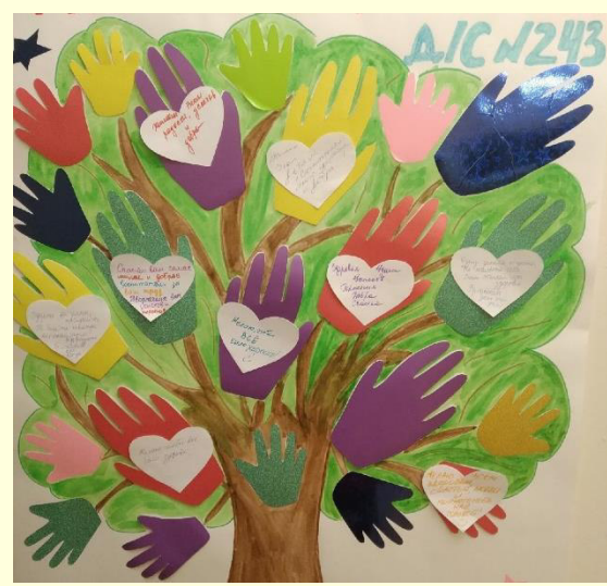
Подготовила: Давыдова М. С.

«День пожеланий» стал завершением Недели Доброты. Родители, дети и педагоги красочно оформили свои пожелания и тёплые слова друг для друга.